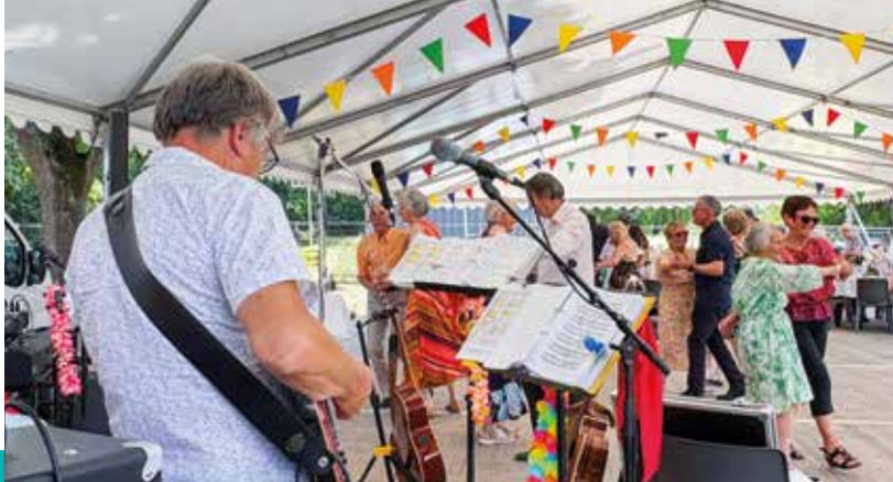
Guinguette de printemps