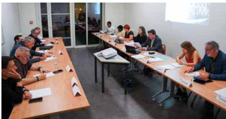
▲ Les membres du Conseil Consultatif Citoyen ont fait part de leurs propositions au Maire et aux élus présents.

Certains d'entre eux ont donc planché sur le centre-ville, partageant la volonté des élus de le redynamiser. Plusieurs suggestions intéressantes ont été formulées. Notamment la création d'événements festifs et d'animations thématiques en centre-ville et sur le marché, afin d'encourager la fréquentation du cœur de ville, ainsi que la valorisation des circuits courts et de produits locaux avec des ateliers et